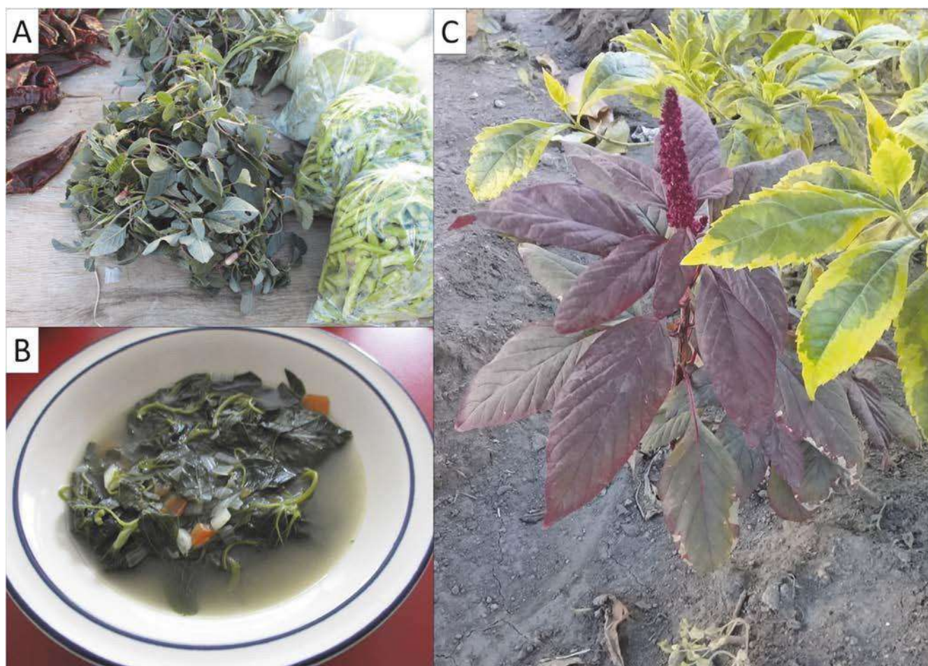
Figura 2. A) Quelites (brotes tiernos de Amaranthus sp.) a la venta junto con otros vegetales en mercado semanal del municipio de Calvillo. B) Caldo de quelite, platillo típico de la región preparado con brotes tiernos de Amaranthus sp. C) Amaranthus cruentus en una jardinera de la zona urbana de la ciudad de Aguascalientes.

otras especies de este género puede ser consumida como verdura. Por otro lado, A. viridis se distribuye únicamente dentro de la mancha urbana de la ciudad de Aguascalientes (Sandoval-Ortega et al. , 2017) y se le puede encontrar durante todo el año en banquetas y camellones, esta especie es consumida como vegetal en varios países, como en la India, donde se le conoce como «Khutura» y es considerado el rey de los vegetales verdes (Nath, 2015); además, sus brotes tiernos se utilizan para preparar potaje (Rapoport et al. , 2009).